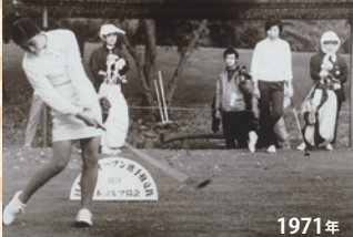
1971年 JGA主催となり大粒CCで開催された日本女子オープン