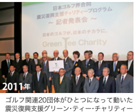
2011年 ゴルフ関連20団体がひとつになって動いた震災復興支援グリーン・ティー・チャリティ