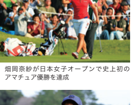
2016年 畑岡奈紗が日本女子オープンで史上初のアマチュア優勝を達成