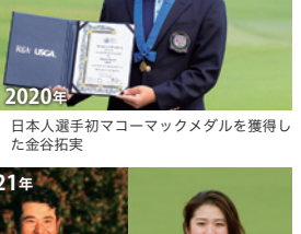
2020年 日本人選手初マコーマックメダルを獲得した金谷拓実