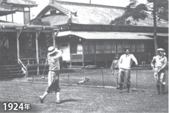
1924年 JGA創立の会合が開かれた東京ゴルフ倶楽部(駒沢)