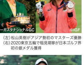
2021年 (左)松山英樹がアジア勢初のマスターズ優勝(右)2020東京五輪で稲見萌華が日本ゴルフ界初の銀メダル獲得