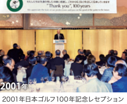
2001年 日本ゴルフ100年記念レセプション