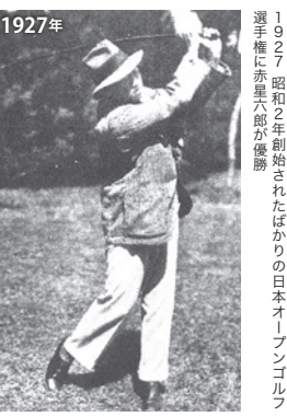
1927年 選手権に赤星八郎が優勝。1927年創始されたばかりの日本オープンゴルフ