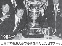
1984年 世界アマボク大会で優勝を果たした日本チーム