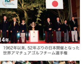
2014年 1962年以来、52年ぶりの日本開催となった世界アマチュアゴルフチーム選手権