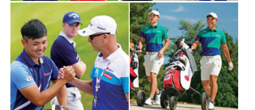
金谷、中島のマコーマックメダル獲得や蟬川の日本OP優勝につながった