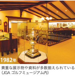
1982年 貴重な展示物や資料が多数揃えられている(JGAゴルフミュージアム内)