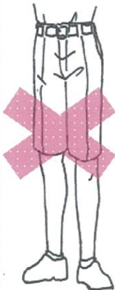
半ズボンに短いソックス