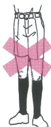
丈の短い半ズボン