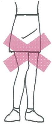
ミニスカート キュロット

※ジーンズ・カーゴパンツ(男子はアウトポケット・インポケット並びにチャックも不可)・スウェット・ジャージ