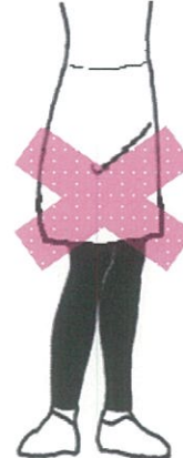
スカートにスパッツ・レギンス類