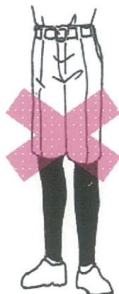
半ズボンにスパッツ・レギンス類