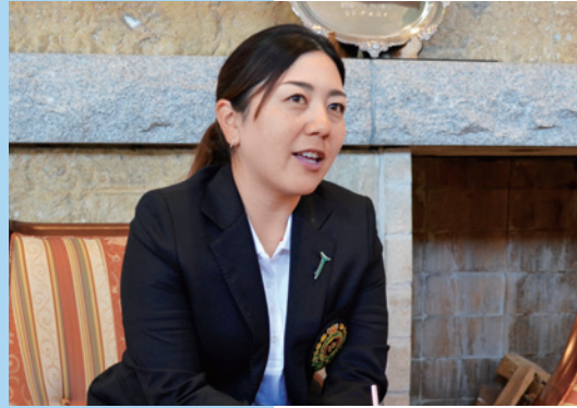
ナショナルチームの経験や米女子ツアー挑戦など当時の心境を語る

山中 高校を出ると、すぐにアメリカに渡りましたよね。日本ではなくアメリカでプロになったのは、どうしてですか。