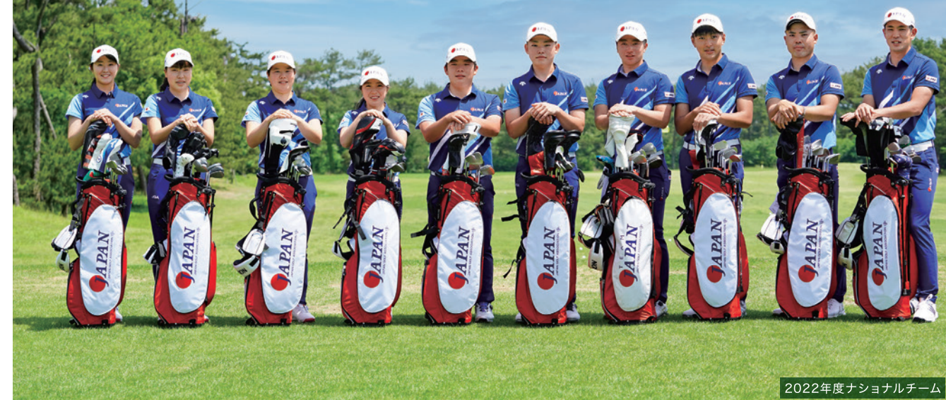
2022年度ナショナルチーム