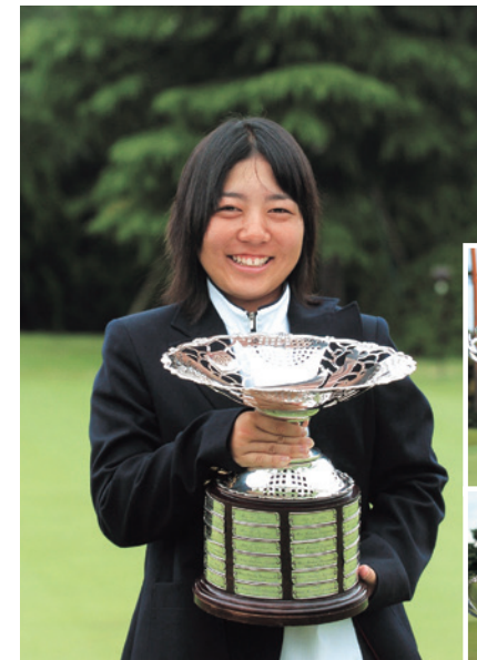
2004年日本女子アマチュアゴルフ選手権優勝 14歳8ヶ月の史上最年少優勝記録を樹立

2006年驚異の大逆転劇で初優勝を飾った日本ジュニアゴルフ選手権(上) 2007年同大会でプレーオフを制し連覇を達成(下)