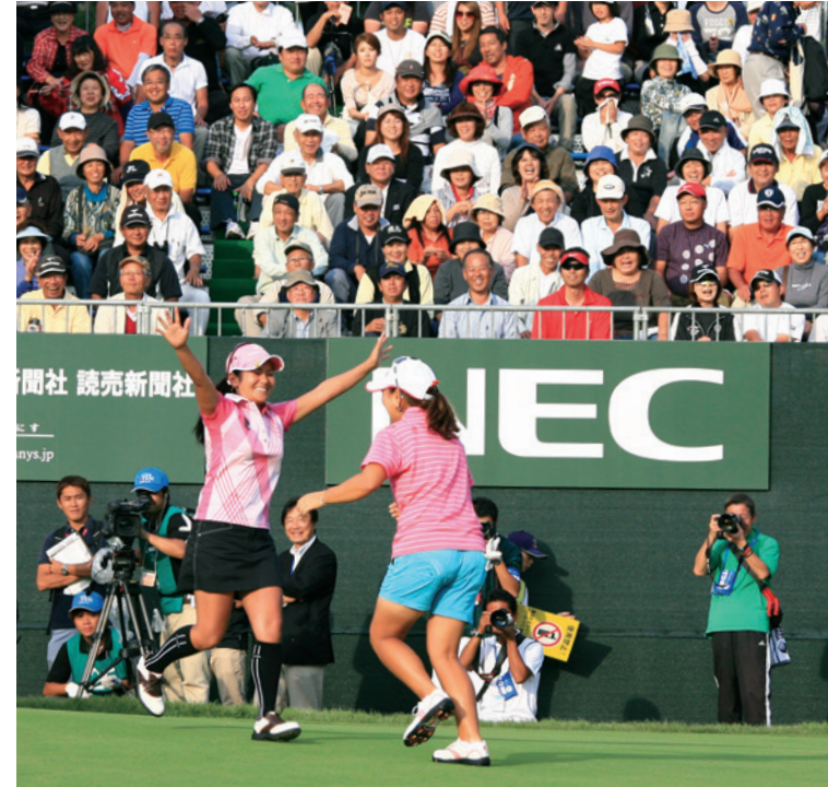
2010年日本女子オープンゴルフ選手権に優勝し同郷の先輩、宮里藍からの祝福を受ける